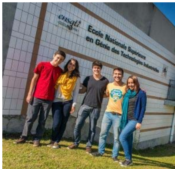
Dans le cadre du programme BRAFITECH, 5 étudiants brésiliens intégrés en 2ème année à l'ENSGTI