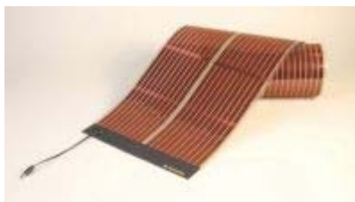
Cellules solaires organiques (CSOs)

ESTABLIS est financé à hauteur de 3,9 M€ (dont 780 K€ pour l'UPPA) par la commission européenne dans le cadre des actions Marie Curie . C'est la première fois qu'un projet européen collaboratif de ce type est coordonné à l'UPPA.