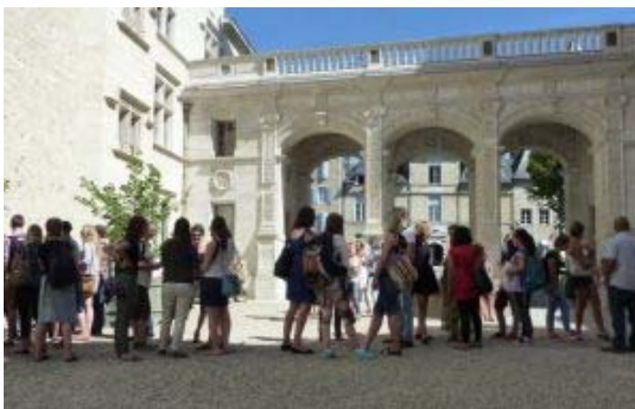
Découverte du château de Pau