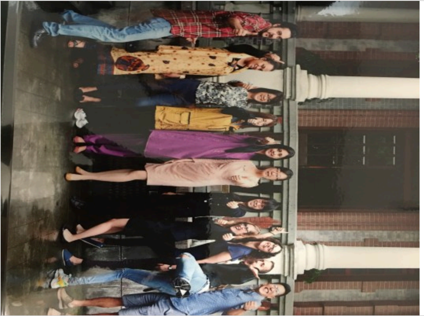
La promotion d'étudiants internationaux, dont une étudiante de l'IAE Pau-Bayonne (au centre), à Jiao Tong University – Shanghai, membre du top 3 des universités chinoises les plus prestigieuses et classée dans les 150 premières universités du classement académique des universités mondiales (ARWU # Academic Ranking of World Universities) ou classement de Shanghai