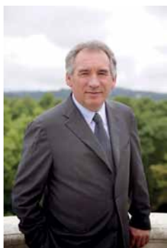
François Bayrou — Maire de Pau — Président de la Communauté d'agglomération Pau Béarn Pyrénées

Pour parler de ces sujets, nous avons fait appel aux meilleurs experts. Des tables rondes associant des acteurs locaux permettront de faire avancer notre projet pour l'agglomération. Des visites et des moments plus festifs viendront nourrir les échanges. Je vous souhaite à tous une excellente semaine, riche de découvertes et de nouvelles pistes de travail.