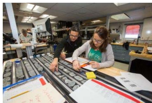
Les scientifiques au travail