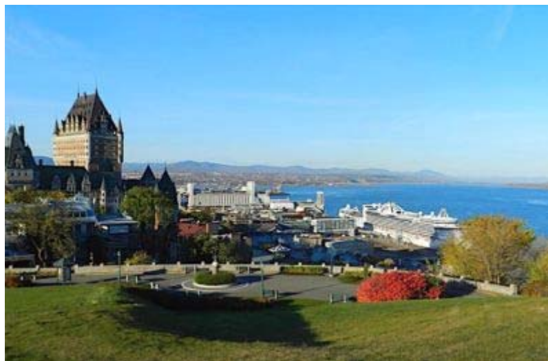
Saint Laurent Frontenac : le centre ville de Qu bec repr sent  par l'emblématique Ch teau Frontenac bord  par le Saint-Laurent

Il me reste encore du temps   passer au Canada ce qui expliquerait que mon t moignage s'av re incomplet mais ce sont mes premi res impressions sur ce pays magnifique, gorg  de ressources et de surprises ».