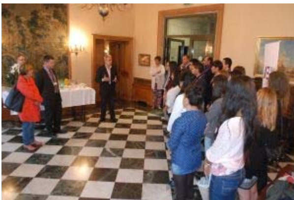
Cérémonie d'accueil des nouveaux étudiants du « International master of Management » et des étudiants internationaux du master "Management international" de l'IAE Pau-Bayonne à la mairie de Bayonne en septembre 2014

L'IAE Pau-Bayonne bénéficie de 45 accords de coopération internationale : Chine, Europe, Canada, Etats-Unis, Amérique Latine... Dans certains masters, les étudiants ont la possibilité d'effectuer un échange académique à l'étranger. L'école accueille, entre autres, des étudiants d'Amérique Latine et des étudiants chinois qui sont recrutés directement en Chine dans leur université d'origine par les enseignants de l'IAE. Depuis plus de 25 ans, l'IAE Pau-Bayonne entretient des liens très étroits avec les universités d'Amérique Latine, des conventions historiques et des échanges réguliers à travers les professeurs invités permettent de consolider ces partenariats.