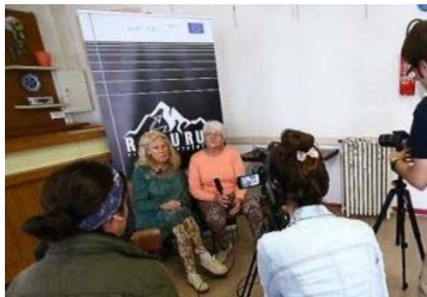
Deux sœurs venues témoigner au nom de leurs parents

L'application de ces travaux verra le jour sous forme de chemins de randonnées agrémentés d'une signalétique à vocation pratique et historique. Un site internet permettra à ceux qui le désirent d'approfondir le sujet et de réaliser ces routes de façon virtuelle à travers leur histoire, des photos, des témoignages, des cartes etc.... De plus une application permettra également de réaliser ces randonnées.