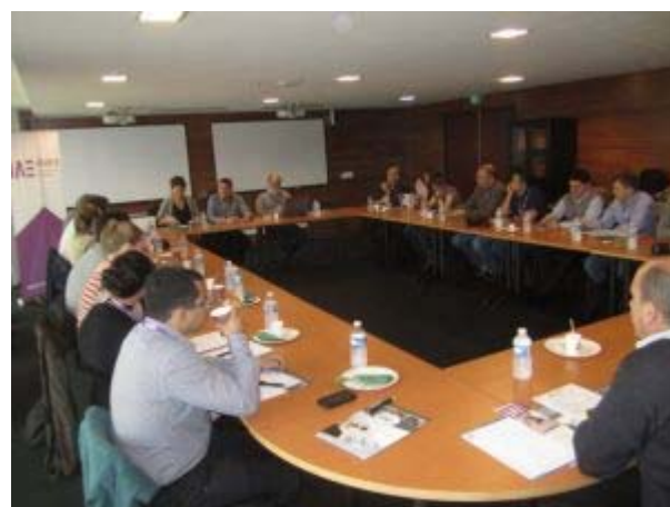
L'IAE Pau-Bayonne, école universitaire de management, accueille une délégation brésilienne