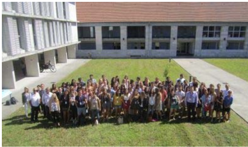
Campus de Pau ou de Bayonne : un IAE, deux sites géographiques, une force d'implantation sur le territoire !