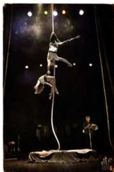
- 220 VOLS - LARSEN

A noter : nouveau cirque Larsen / Compagnie 220 vols , le 29 septembre, à l'occasion de la Journée sport, culture, santé