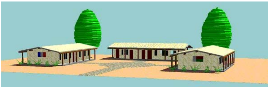
Maquette du lycée

L'inauguration du nouveau bâtiment est programmée le 31 mars prochain et le retour des étudiants aura lieu le 3 avril. Un film retraçant cette fabuleuse expérience humaine sera projeté le 7 avril après-midi sur le campus de Montaury à Anglet.