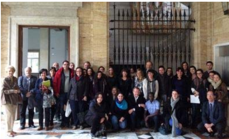
Photo de groupe à l'Université de Navarre