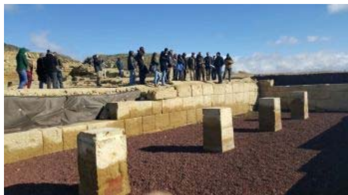
Visite du forum de Los Bañales