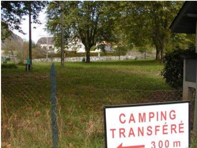
Béost : ancien camping déplacé en raison des risques torrentiels. A l'arrière-plan, enrochements pour protéger les maisons riveraines du cours d'eau.