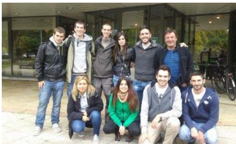
Au premier plan, deux étudiantes espagnoles et deux étudiants UPPA en génie électrique

Mission accomplie pour l'UPPA puisque trois étudiants envisagent, d'ores et déjà, d'effectuer, l'an prochain, leur année de master à Pau !