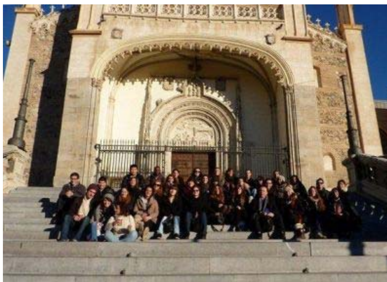
Le groupe devant l'église San Jerónimo el Real

Lors de ces différentes visites qui ont permis d'approcher la production d'artistes essentiels de l'histoire de l'art (Bosch, Titien, Rubens, Goya, Picasso ou Dali), l'accent a été porté également sur l'étude muséographique des différents lieux visités, afin de préparer les étudiants au master « Métiers de l'exposition » à leur future insertion professionnelle. Un fascicule de 13 pages, rédigé par les enseignants et illustré de photographies, a été distribué à chaque étudiant, quelques jours avant le départ en Espagne, afin de les préparer aux différentes visites. À l'issue de ce voyage pédagogique, inscrit dans la maquette des études, les étudiants devront remettre un dossier d'analyses d'œuvres de leur choix qui sera noté.