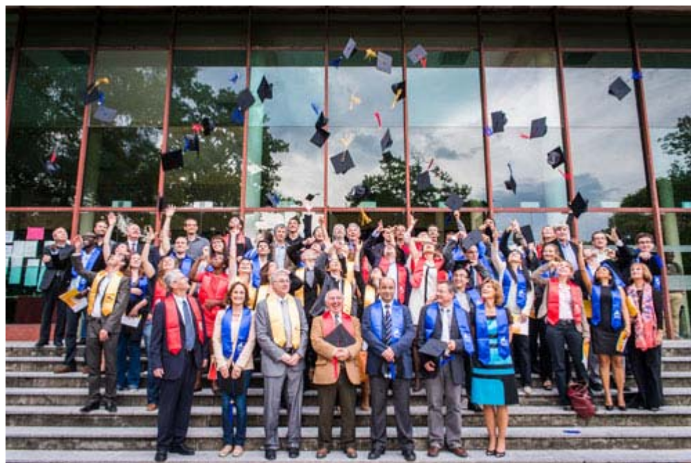
Cérémonie de remise des diplômes de doctorat - Crédit photo Antoine Pursuibes

Cérémonie de remise des diplômes de doctorat