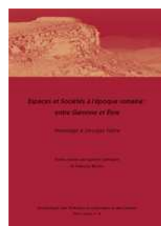
Espaces et sociétés à l'époque romaine : entre Garonne et Tibre