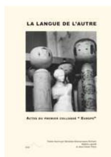
La langue de l'autre : acte du premier colloque "Europe"