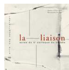
La liaison : acte du 8ème colloque du CICADA