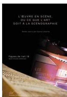
L'œuvre en scène ou ce que l'art doit à la scénographie

Le service des PUPPA crée et réalise les couvertures, les maquettes des ouvrages, met en pages et en forme les articles, les corrige, les importe vers les logiciels de PAO et traite les images (numérisation, retouche, mise à l'échelle, etc.). L'ensemble de la conception est naturellement étudié en étroite collaboration avec les auteurs.