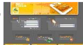
Schéma du dispositif

Suite au retour positif de l'appel d'offres ministériel sur la mise en place de solution de podcast, l'UPPA propose une chaîne éditoriale podcast complète appelée MediaKiosque.